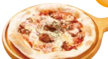
ミラノ風半なま超うすクラスト生地 ベーコンときのこのトマトソースピザ