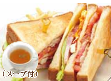
(スープ付) 特製ローストチキンの クラブハウスサンド