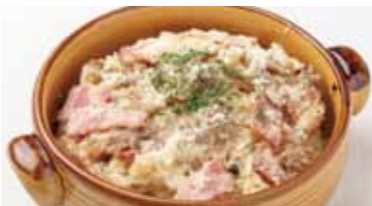
濃厚クリームソースの たっぷりキノコリゾット