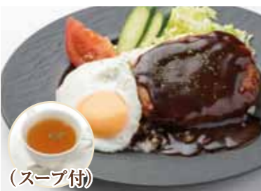
(スープ付) ハワイの定番 ファイン特製ロコモコ