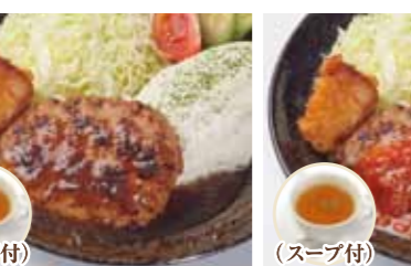
(スープ付) 和風ハンバーグ