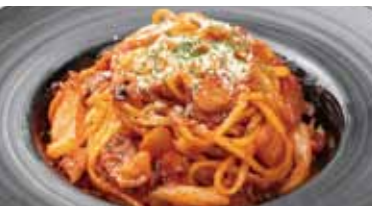
大人の プレミアムナポリタン