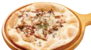
ミラノ風半なま超うすクラスト生地 ベーコンときのこのクリームソースピザ