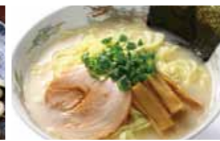
本格こだわりラーメン <醤油・塩・豚骨>