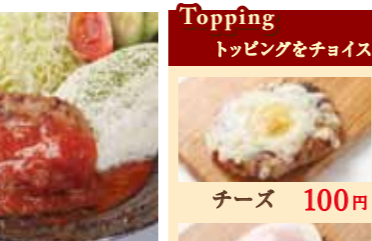
(スープ付) イタリアンハンバーグ