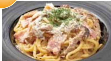
香り豊かなポルチーニ クリームソースパスタ