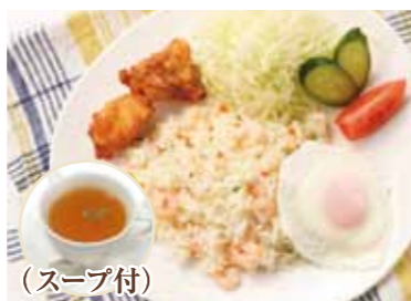
(スープ付) エビピラフセット