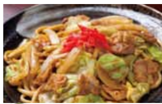
「手延べ勝り」うどん使用 ソースキャベ焼うどん