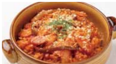
濃厚トマトソースの プレミアムリゾット