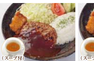
(スープ付) デミグラスハンバーグ