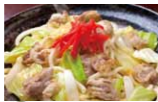
「手延べ勝り」うどん使用 豚塩キャベ焼うどん